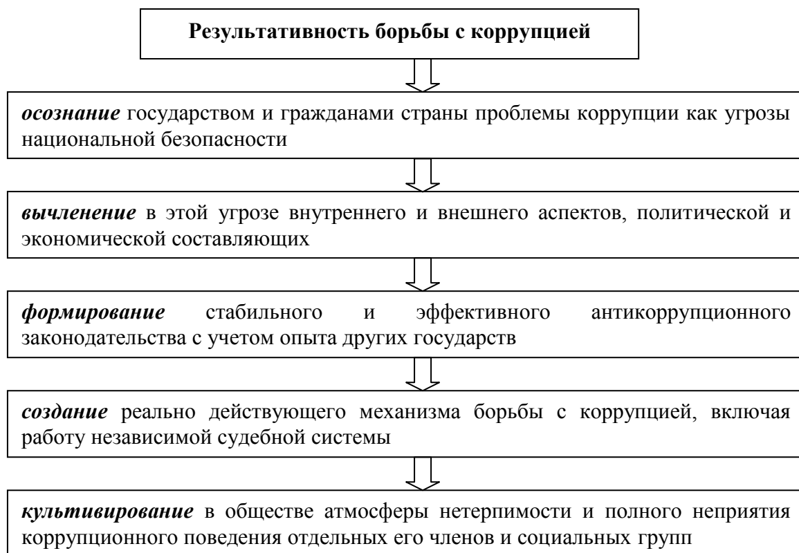
Схема 2. «Цепочка результативности» борьбы с коррупцией

Вместе с тем международный опыт борьбы с коррупцией показывает, что успех в ней зависит от целого ряда факторов, но в целом своеобразная «цепочка результативности» может быть представлена следующим образом (см. схему 2).